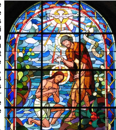
Abbatiale de Saint Florent le Vieil, Maine et Loire

En ce dimanche, nous avons la joie de célébrer le baptême de 4 enfants de l'école primaire de l'Ensemble scolaire Saint Pierre Fourier, au cours de la messe de 10h45. Alors que nous avons célébré, lundi dernier, la fête du Baptême du Seigneur qui est venue clore le temps de Noël, ces baptêmes d'enfants nous invitent à raviver en nous la grâce de notre propre baptême.