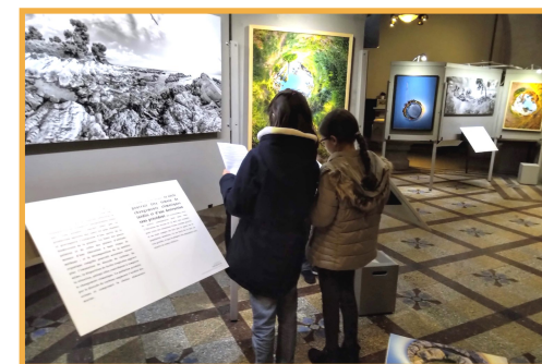
A gauche, à l'inauguration de l'exposition; à droite, des enfants de l'aumônerie suivent le « jeu de piste ».