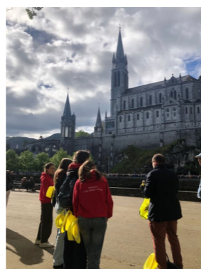
Montane Responsable de l'aumônerie

Le FRAT c'est pas fini ! Le FRAT c'est pour la vie !